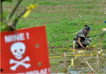
Bild: Minensuche nach der Flut

Was gibt es Neues von Bosnien-Herzegowina? In Bosnien Herzegowina fanden am 12. Oktober landesweit in beiden Landesteilen allgemeine Wahlen statt. Gewählt wurden die drei ethnisch besetzten Mitglieder der Präsidentschaft, das gesamtstaatliche Parlament von BiH, das Parlament der Förderung von BiH sowie die Versammlung der